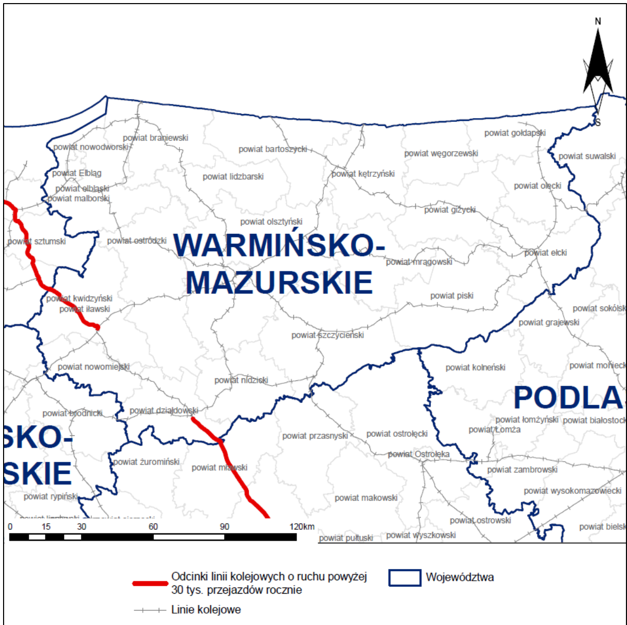
Rys. 2 Lokalizacja analizowanych linii kolejowych na tle analizowanego województwa

Województwo warmińsko-mazurskie zlokalizowane jest w północnej części Polski. Graniczy od zachodu z województwem pomorskim, od wschodu – z województwem podlaskim, a od południa – z województwem mazowieckim.