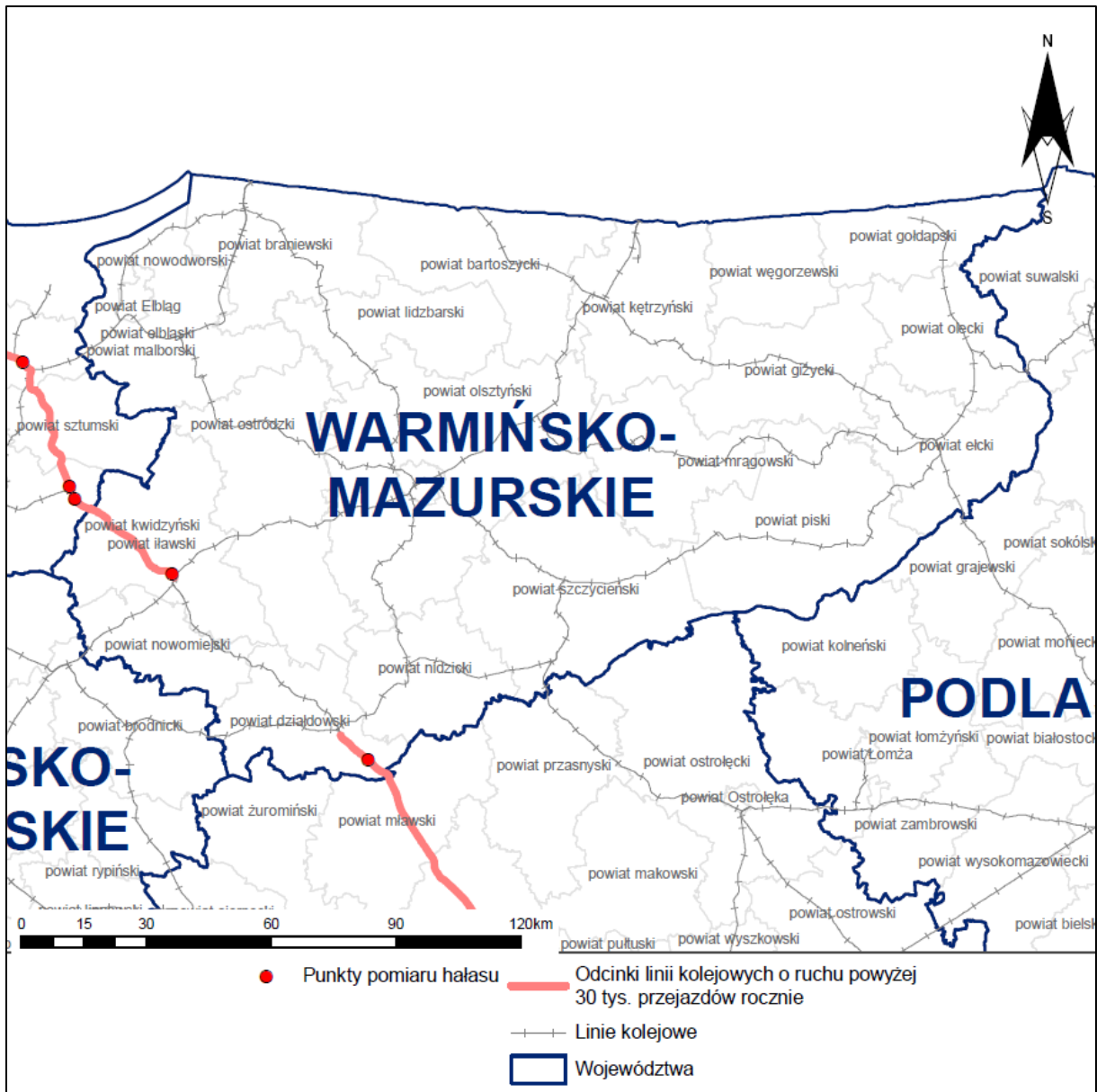
Rys. 4 Lokalizacja punktów pomiarów hałasu kolejowego wykonywanych w ramach opracowania na terenie analizowanego województwa

Właściwej weryfikacji modelu akustycznego dokonano wykorzystując proces kalibracji porównując metodę obliczeniową z metodą pomiarową. W procesie kalibracji wykorzystano wyniki pomiarów z 146 lokalizacji obejmujących odcinki jednorodne pod względem warunków eksploatacyjnych, przy których możliwe było wykonanie pomiarów hałasu zgodnie z wymaganiami procedury pomiarów ekspozycyjnych dźwięku w odniesieniu do pojedynczych zdarzeń akustycznych. Proces kalibracji przeprowadzono dla danych zarejestrowanych dla pory nocnej, która ze względów akustycznych jest bardziej newralgiczna. Warunek konieczny równoważności metody pomiarowej i obliczeniowej, zgodnie z zapisem punktu H „Procedura obliczeniowa” załącznika nr 3 do rozporządzenia [4], został zachowany. Otrzymany wynik wynosi 2,4 dB, co świadczy o poprawności przyjętego modelu obliczeniowego.