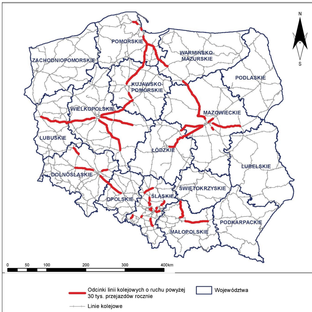
Rys. 1 Lokalizacja analizowanych linii kolejowych na tle województw Polski