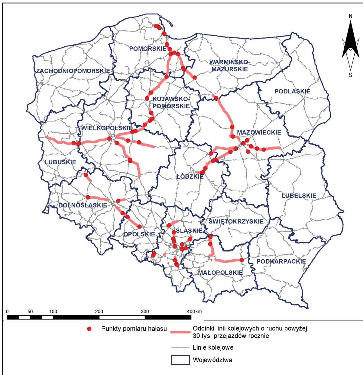
Rys. 3 Lokalizacja wszystkich punktów pomiarów hałasu kolejowego wykonywanych w ramach opracowania na tle województw Polski