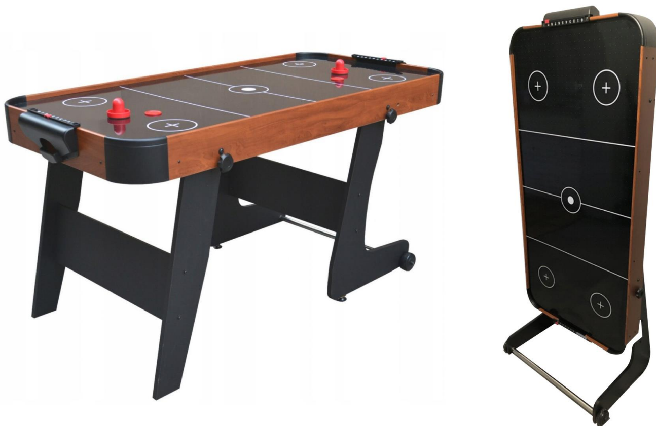
Zdjęcie nr 12