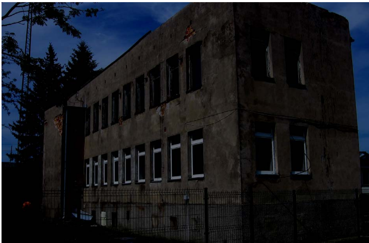
Widok budynku od strony południowej