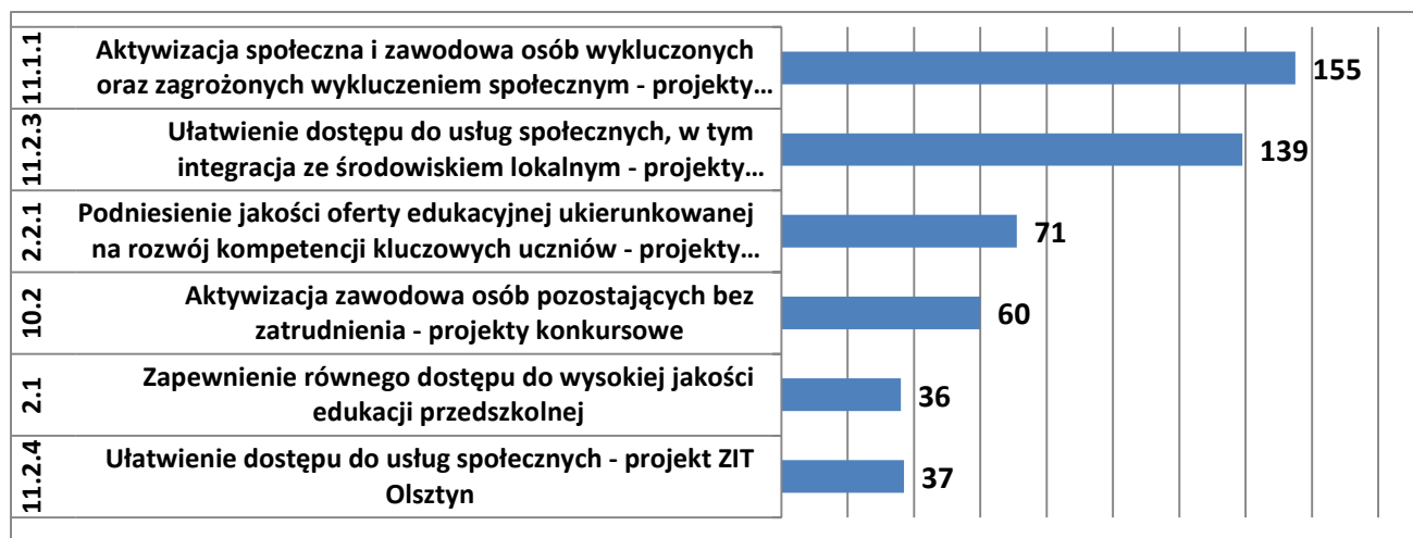
Wykres 1. Liczba dofinansowanych projektów organizacji pozarządowych w ramach działań RPO WiM 2014-2020 (według zawartych umów)